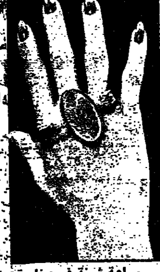
عق جليل يؤمنه

وقد عكف الفرسان في عهد الملك ايرت في القرن السادس عشر وبداية السابع عشر اكثر من اي وقت مضى ، على الانعام بالحلي والمجوهرات ، فاشقوا فرقا فرساقية خاصة لرمت من هذه الثروات الثمينة المصنوعة ، وكانوا اذا ذك على خلاف مع الكنيسة او السلطة البابوية واسخطاها بعد مؤثر الكنيسة المستورة المشهورة القاتل على اياها بعد ان قتلوا له الهدايا مع الحلي والمجوهرات وكان فرسان الملك وحاكمتيه وقاتلونه ويحلون جياهم بالحلي الفريية الصنع ،